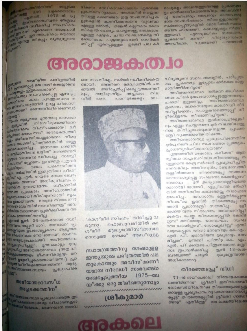
ഫോട്ടോ 2: അടിയന്തരാവസ്ഥ മാതൃഭൂമിയിൽ (25 ജനുവരി 1976 പേജ് 39)