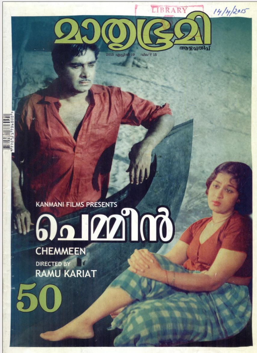
ഫോട്ടോ 6: ചെമ്മീൻ 50 മാതൃഭൂമിയിൽ (19 ഏപ്രിൽ 2015 മുഖചിത്രം)