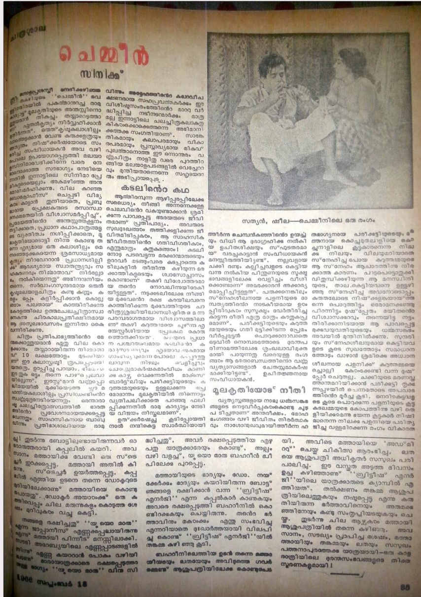
ഫോട്ടോ 5: ചെമ്മീൻ പിറവി മാതൃഭൂമിയിൽ 14 സെപ്റ്റംബർ (1966 പേജ് 35)