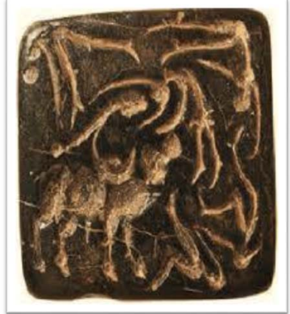
சிந்துவெளி ஏறுதழுவுதல் படிமம்